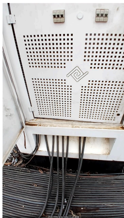
CONEXÃO DOS CABOS NO GERADOR