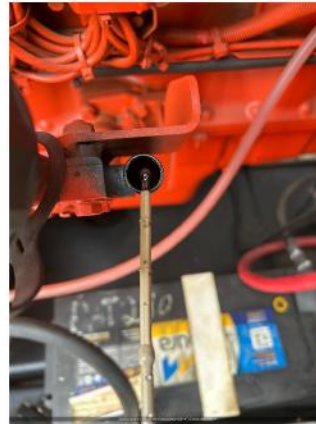
FOTO ESCALA RINGELMANN

VERIFICAR CONDIÇÕES DE ABRAÇADEIRAS NO MOTOR OK