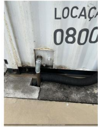
FOTO DO TAMPÃO DE DRENO DA BACIA DE CONTENÇÃO