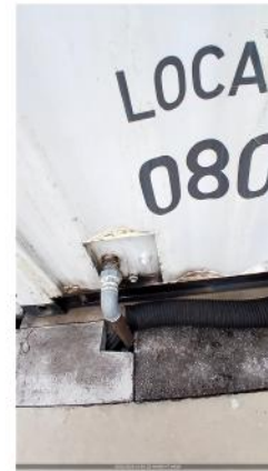
FOTO DO TAMPÃO DE DRENO DA BACIA DE CONTENÇÃO