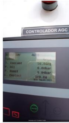
FOTO DO CONTROLADOR COM O VALOR DE TENSÃO DA BATERIA