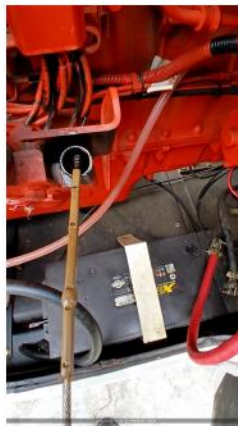
FOTO ESCALA RINGELMANN