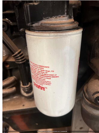
FOTO DOS FILTROS

QUAIS OS PROBLEMAS IDENTIFICADOS NO MOTOR? Faltando retentor traseiro