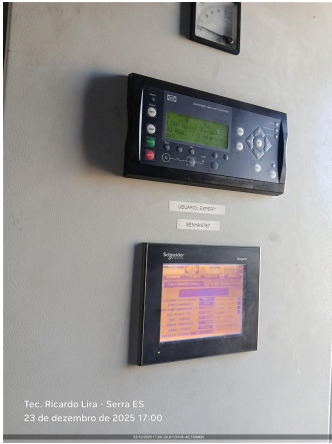
Tec. Ricardo Lira - Serra ES 23 de dezembro de 2025 17:00