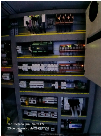
Tec. Ricardo Lira - Serra ES 23 de dezembro de 2025 17:00