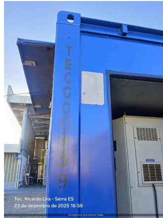
Tec. Ricardo Lira - Serra ES 23 de dezembro de 2025 16:59