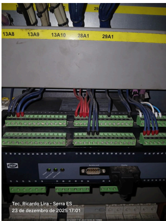
Tec. Ricardo Lira - Serra ES 23 de dezembro de 2025 17:01