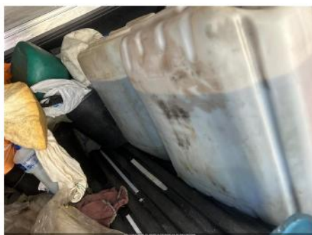
FOTO DO ÓLEO LUBRIFICANTE VELHO