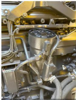
FOTO DO FILTRO DE COMBUSTÍVEL VELHO

FOTO DA MARCAÇÃO DA DATA DA TROCA NO FILTRO DE COMBUSTÍVEL