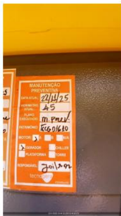
FOTO DO HORIMETRO