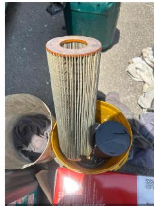
FOTO DA MARCAÇÃO DA DATA DA TROCA NO FILTRO LUBRIFICANTE

FOTO DO FILTRO DE ÓLEO LUBRIFICANTE VELHO