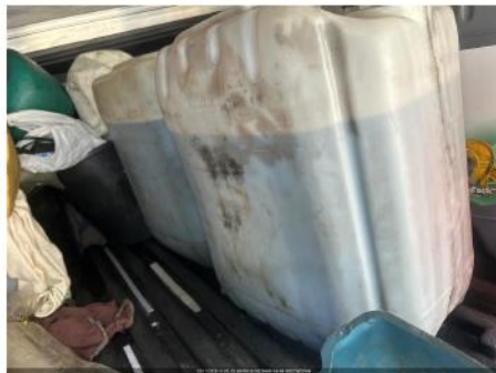
FOTO DO FILTRO DE ÓLEO LUBRIFICANTE VELHO