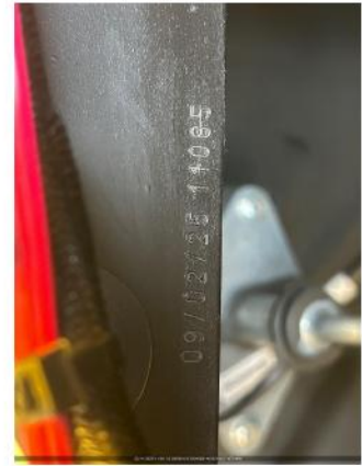
FOTO DA DATA DE FABRICAÇÃO E VALIDADE DA BATERIA