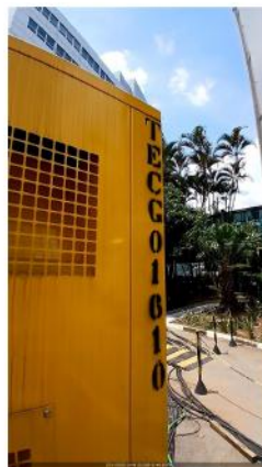
FOTO IDENTIFICAÇÃO DO PATRIMONIO