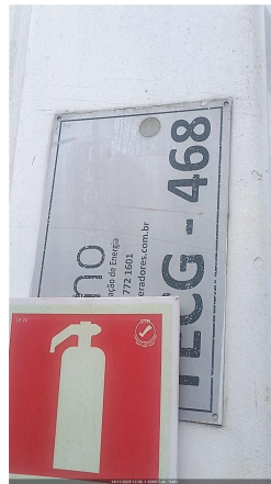
FOTO IDENTIFICAÇÃO DO PATRIMONIO