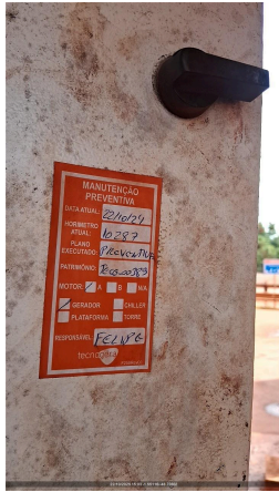
FOTO DO HORIMETRO