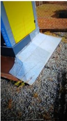
FOTO DO TAMPÃO DE DRENO DA BACIA DE CONTENÇÃO