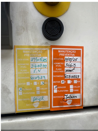
FOTO IDENTIFICAÇÃO DO PATRIMONIO