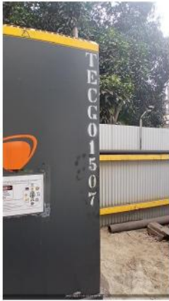
FOTO IDENTIFICAÇÃO DO PATRIMONIO