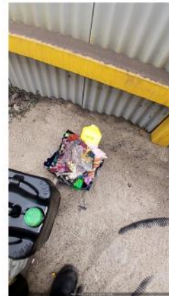
FOTO DO FILTRO DE COMBUSTÍVEL VELHO