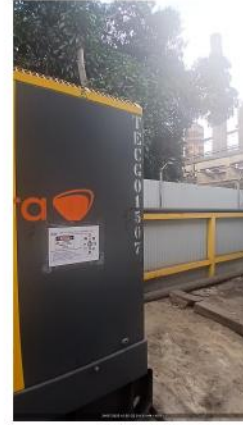
FOTO IDENTIFICAÇÃO DO PATRIMONIO

O MARCADOR DE NÍVEL POSSUI SENSOR DE TELEMETRIA?