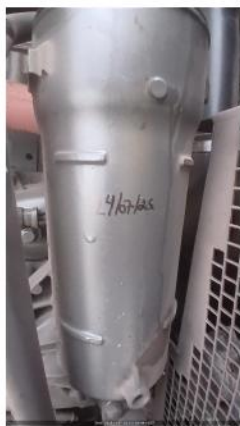
FOTO DA MARCAÇÃO DA DATA DA TROCA NO FILTRO LUBRIFICANTE