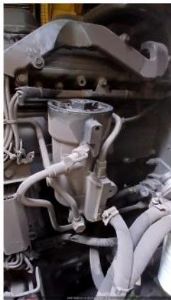
FOTO DA MARCAÇÃO DA DATA DA TROCA NO FILTRO SEPARADOR DE ÁGUA

FOTO DA MARCAÇÃO DA DATA DA TROCA NO FILTRO DE COMBUSTÍVEL