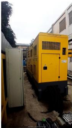
FOTO LATERAL ESQUERDA