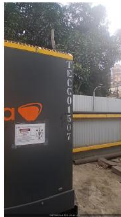
FOTO IDENTIFICAÇÃO DO PATRIMONIO