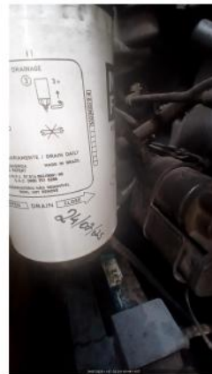
FOTO DO FILTRO SEPARADOR DE ÁGUA VELHO

FOTO DA MARCAÇÃO DA DATA DA TROCA NO FILTRO SEPARADOR DE ÁGUA