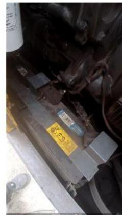
FOTO DA DATA DE FABRICAÇÃO E VALIDADE DA BATERIA