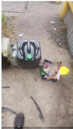
FOTO DO ÓLEO LUBRIFICANTE VELHO