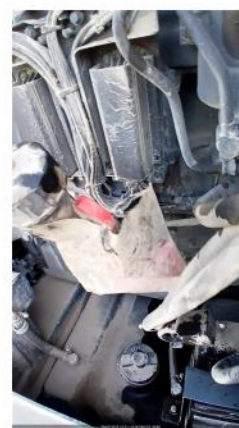
FOTO DA VARETA DE ÓLEO LUBRIFICANTE