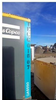
FOTO IDENTIFICAÇÃO DO PATRIMONIO