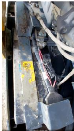
FOTO DA DATA DE FABRICAÇÃO E VALIDADE DA BATERIA

CASO APLICAVEL COMPLETAR AGUA DA BATERIA OK