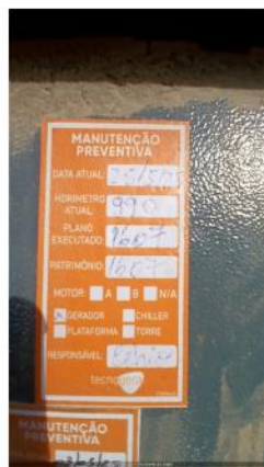
FOTO DO HORIMETRO