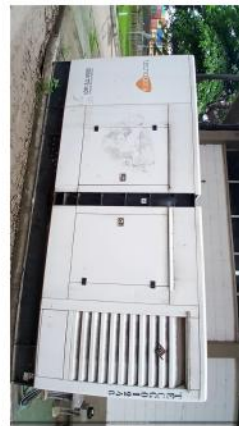
FOTO LATERAL ESQUERDA