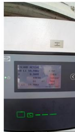
FOTO DO TESTE COM CARGA