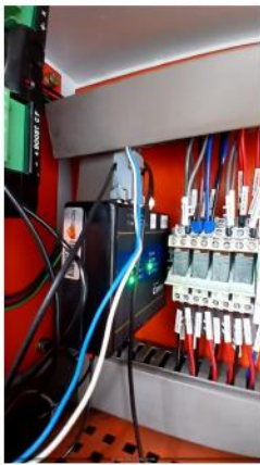
FOTO DO HORIMETRO